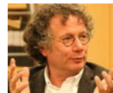
44 Инго Шульце Ingo Schulze