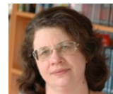
28 Людмила Петрановская Ludmila Petranovskaya