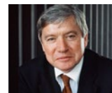
26 Пер Оргорд Per Øhrgaard