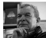
31 Ласло Райк László Rajk