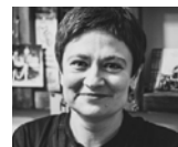
43 Ольга Шпарага Olga Shparağa