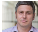
19 Мариус Ивашкевичиус Marius Ivaškevičius