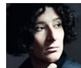
36 Мария Степанова Maria Stepanova