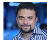
10 Александр Архангельский Aleksandr Arkhangelskiy