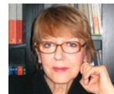
12 Соня Бисерко Sonja Biserko