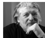
37 Протоиерей Алексий Уминский Archpriest Aleksiy Uminskiy